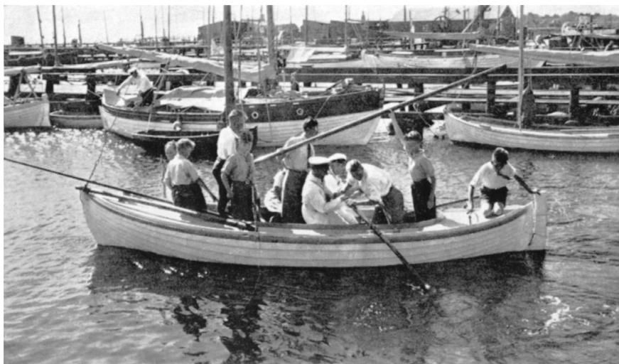
D.S.s første øvelsesbåd "Tove".

problemer også dengang var om foråret. Under krigen fik man således påbud om at fjerne roret fra bådene, som stod på land, og kunne dette ikke lade sig gøre f. eks. på kutterne med fast ror, skulle rorpinden skrues af og fjernes.