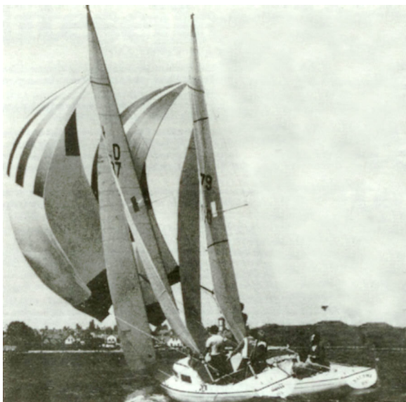
Billedet viser en skarp og meget tæt duelsejlad ud for Dragør i 1979. Sejladsen fandt sted 2. Pinsedag. Duelsejladserne var den spæde opstart til det, der i dag kaldes matchrace.