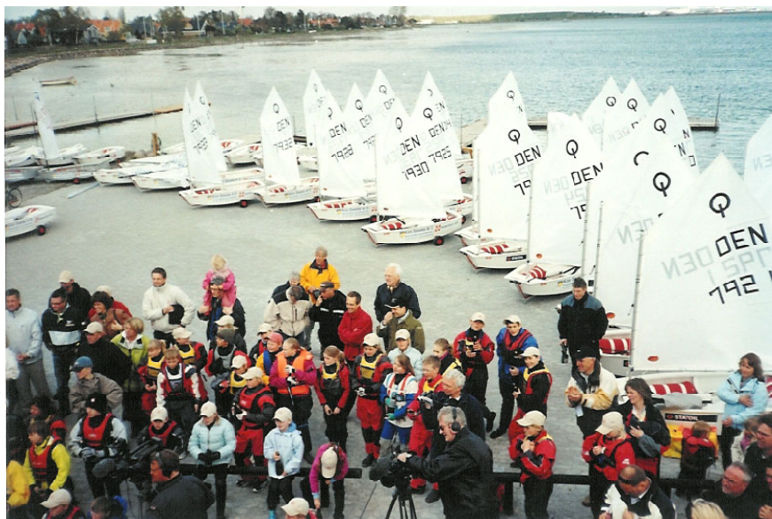
50 nye optimistjoller døbes i champagne.