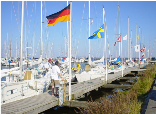
Dragør Sejlklub var vært for International Ballad Cup i 2004.

I vinteren 2003 begyndte medlemmer af Dragør Sejlklub at stå på ski sammen, nærmere betegnet i Wagrain i Østrig.