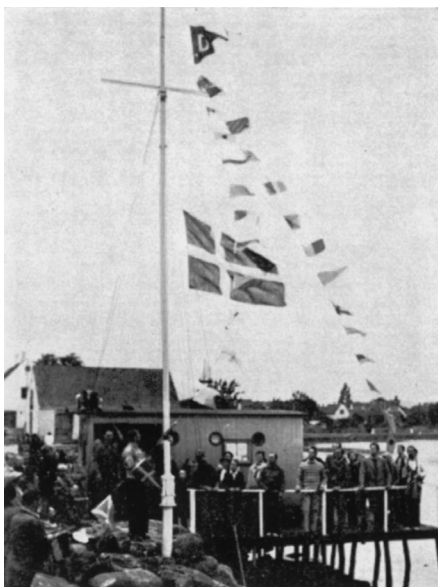
Fartøjsstationen i 1924 og standerhejsning ved det gamle klubhus.