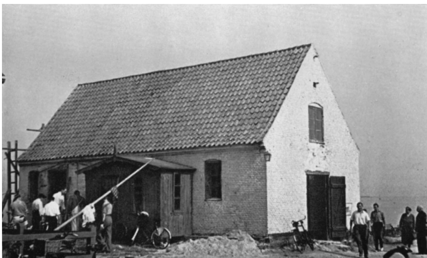
Greisens pakhus 1949 før ombygningen.

Der anskaffedes et elektrisk spil til beddingen, hvilket i høj grad lettede arbejdet med optagning af fartøjerne. En længe savnet mastekran