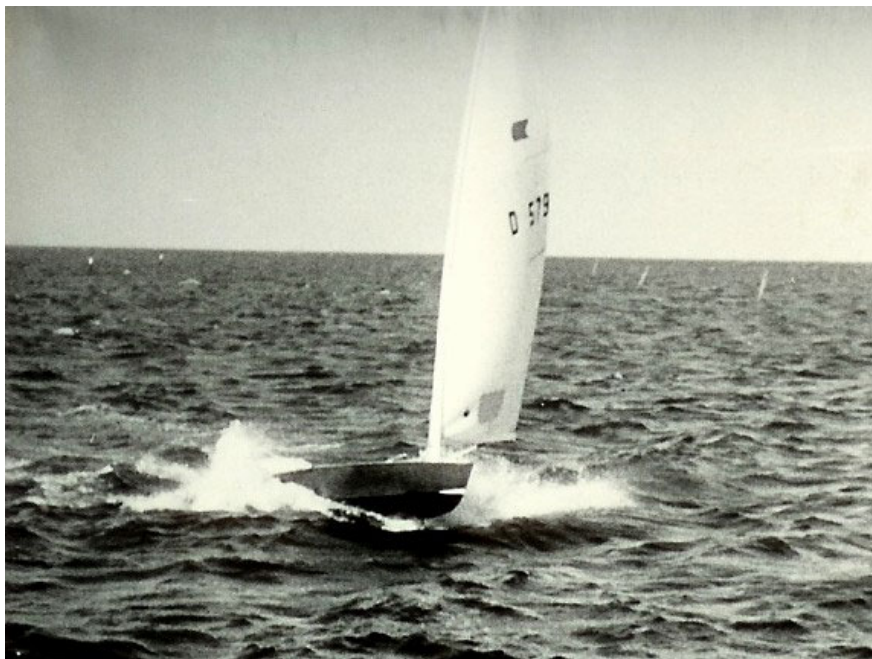
Planende Ok-jolle i perfekt balance, nord for havnen under land.

Og man må indrømme, at det vejrmæssige held ikke rigtig var med pionererne i starten. Man erindrer nogle af de første starter, hvor det blæste med meget kraftig vindstyrke, så dommerne ikke turde lade jollerne sejle på den almindelige jollebane, men lod dem sejle i området nord for havnen under land, og hvor de fleste af dem væltede - selvfølgelig til stor morskab for »spåmændene«. En senere landskendt O.K.-jollesejler stod på det flade vand helt inde ved stenkanten ved