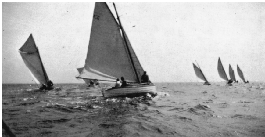
Første og anden start er gået.

og ligeledes var præmietagernes navne gengangere, som de er det i dag.