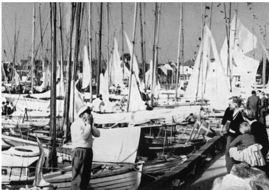
Trængsel af fartøjer i havnen ved en fællessejls.

pladsen. Der dukkede mange gode juniorsejlere op, og der blev hentet mange præmier hjem fra udenbys sejladser. Vi gjorde os gældende ved danmarksmesterskaberne, blev udtaget til verdensmesterskabssejladser og til nordiske mesterskaber o. m. a. Det ville føre for vidt at nævne navne. Der står i dag respekt om Dragør Sejlklubs juniorsejlere over hele landet.