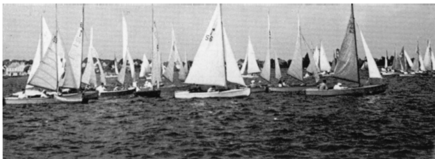
Fra fællessejladsen ud for Dragør 14. sept. 1949.

roret«, og hvor han - når man svedige af at mase - nåede tæt ved mål-stregen, skød sejladsen af. Det var vel nok for at placere sig, at der blev sejlet, men det var minsandten også for at more sig.