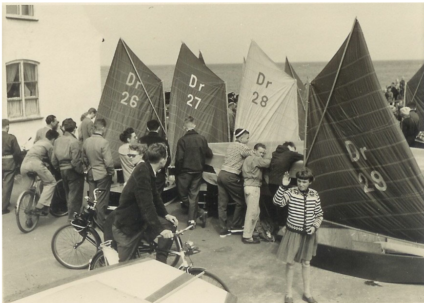
7 optimistjoller døbes i 1954.

Det var et stort øjeblik, da jollerne efter flere officielle taler blev sat i vandet, og bygmestrene tog den første sejltur, men det viste sig snart, at det var at bygge en jolle, noget andet at føre den, og det var denne