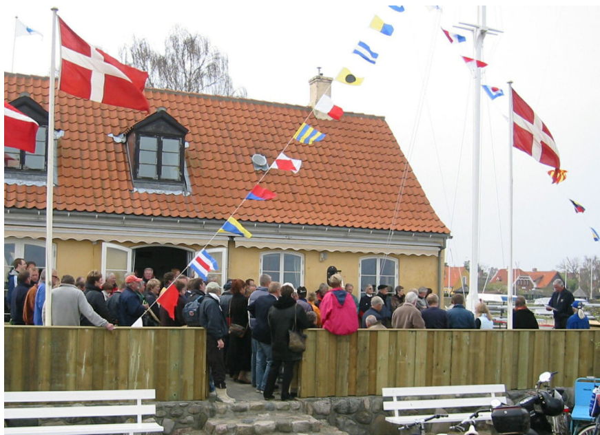
Indvielsen af den nyrenoverede Madsens Krog i 2005.

Den 6. maj 2005 blev der døbt 50 nye optimistjoller i champagne. Efter dåben blev de udleveret til 10 sejlkubber, efter en ny model. Modellen, der er en kombination af sponsorbidrag, finansiering og stor-